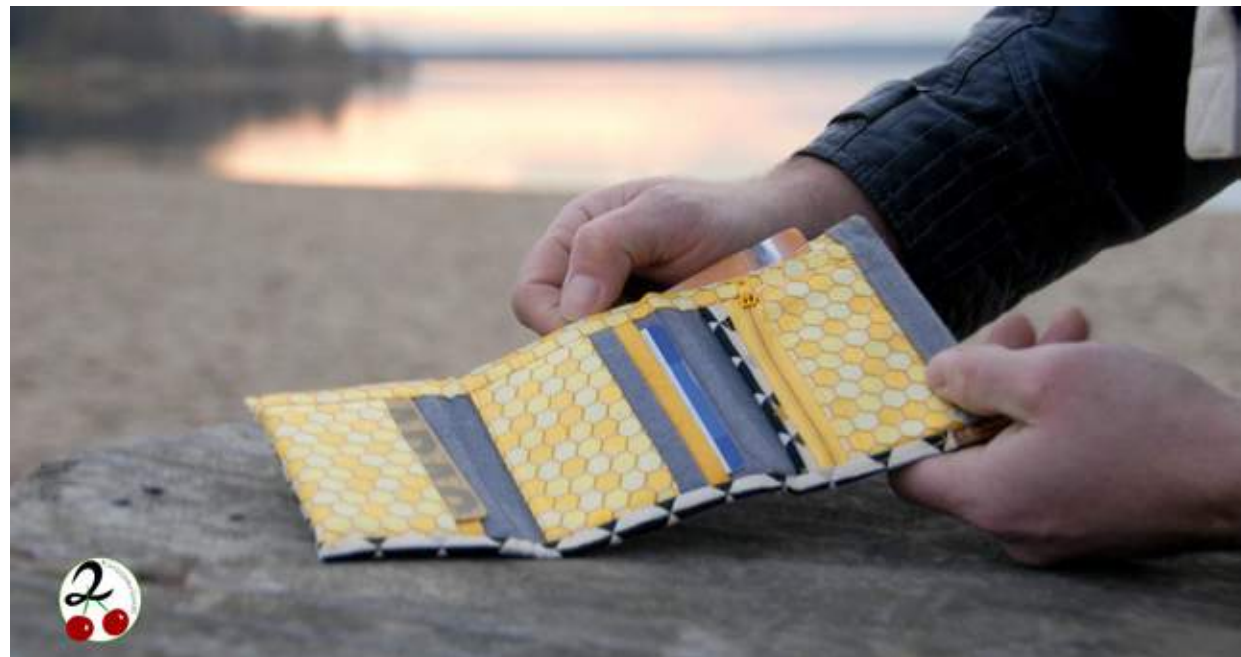
Romy Kirsche Kirschkrümel genäht mit einer Bernina B380