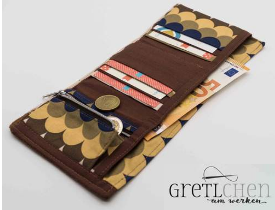
Gretl Kanzler Gretlchen am werken